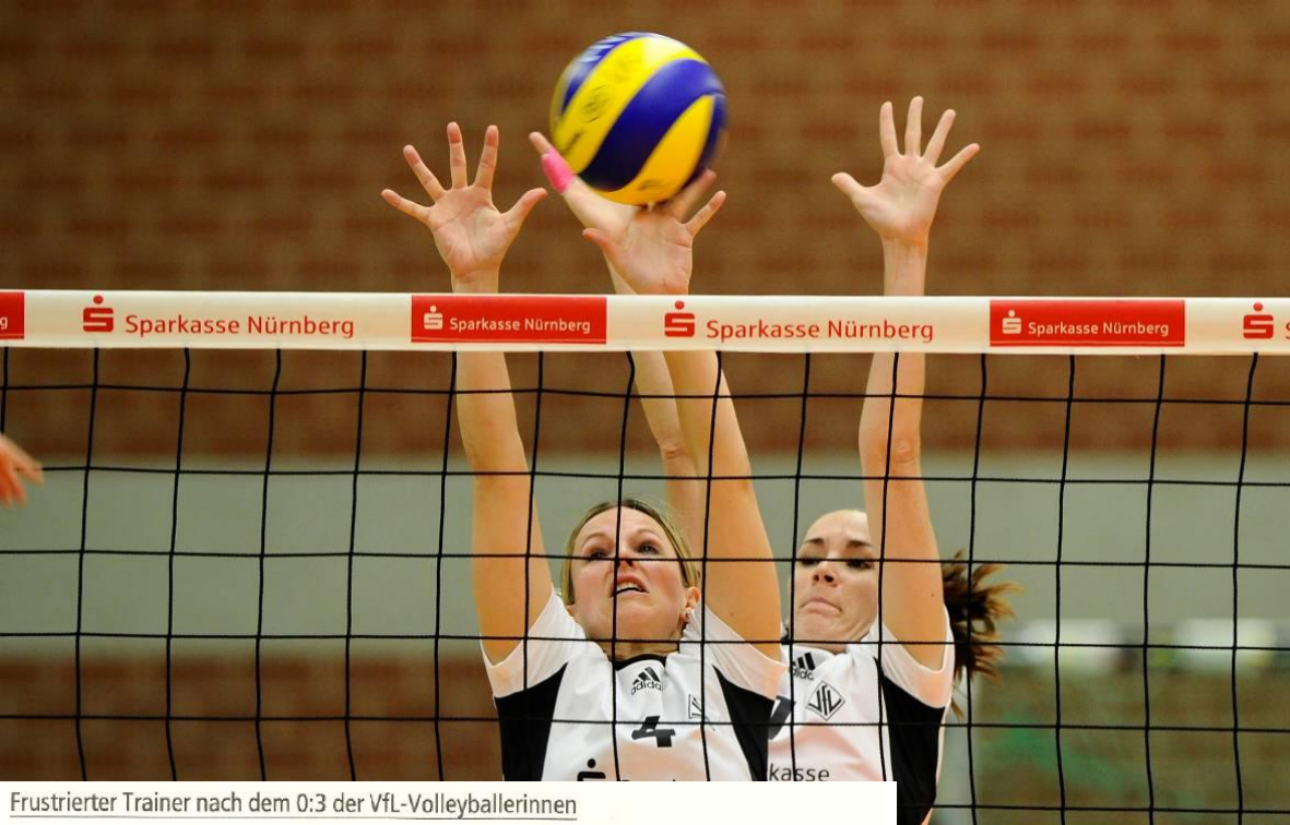
Frustrierter Trainer nach dem 0:3 der VfL-Volleyballerinnen