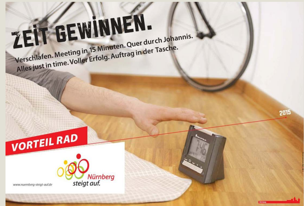
Motiv Kommunikationskampagne „Nürnberg steigt auf“