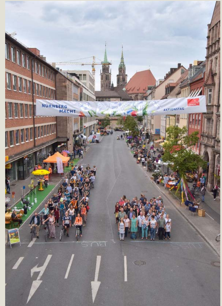
Aktionstag „Nürnberg macht Platz“ 2018