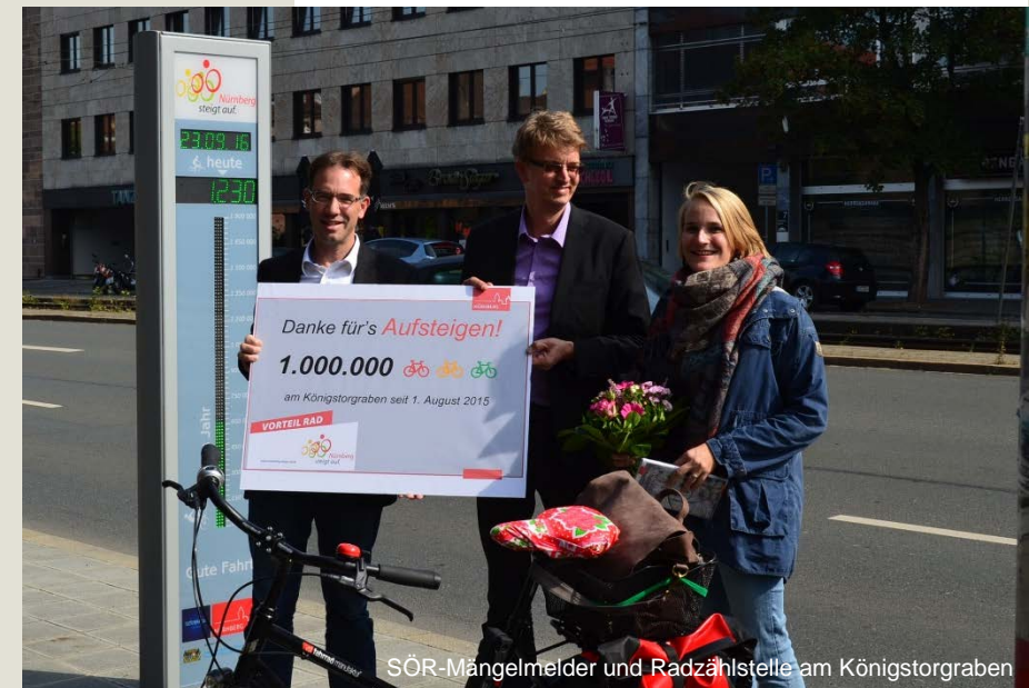
SÖR-Mängelmelder und Radzählstelle am Königstorgraben