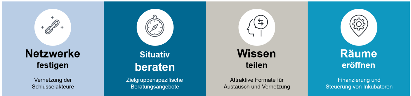
Abbildung 3: Handlungsfelder Startup City Nürnberg

Quelle: PureSolution / shutterstock.com, eigene Darstellung