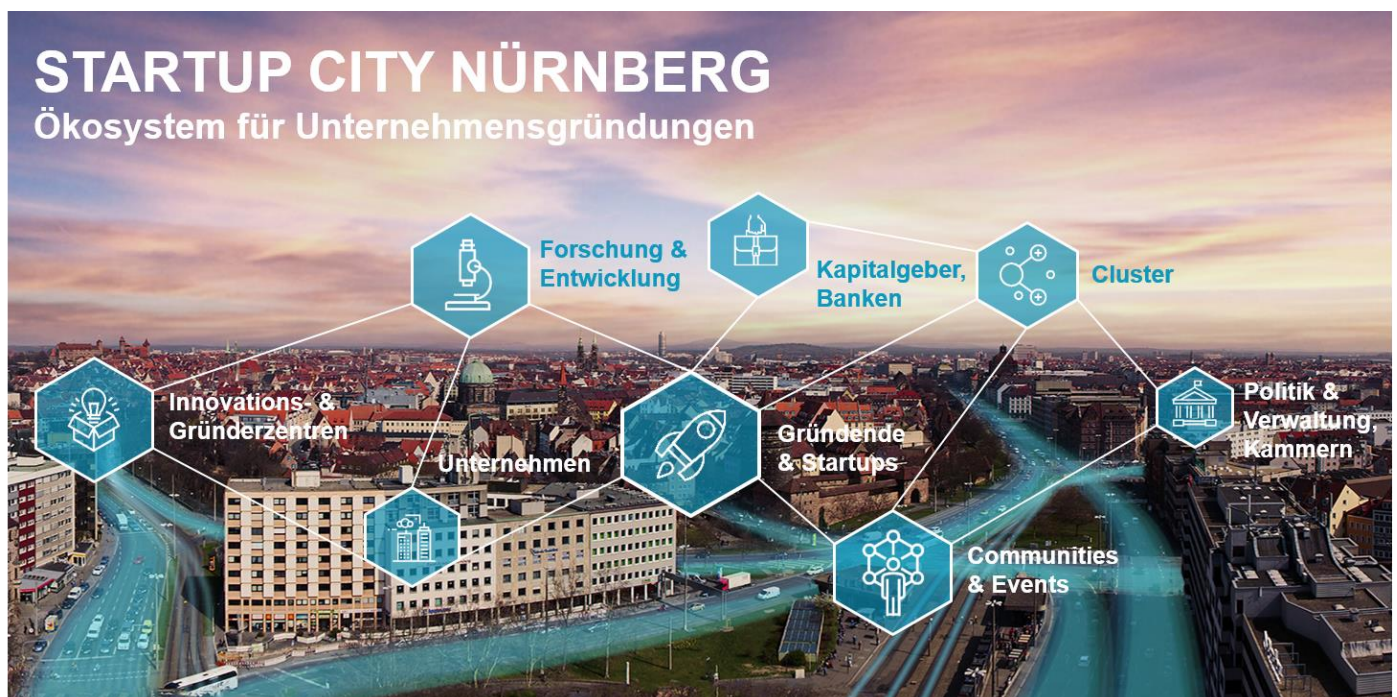
Abbildung 1: Ökosystem für Unternehmensgründungen am Wirtschaftsstandort Nürnberg