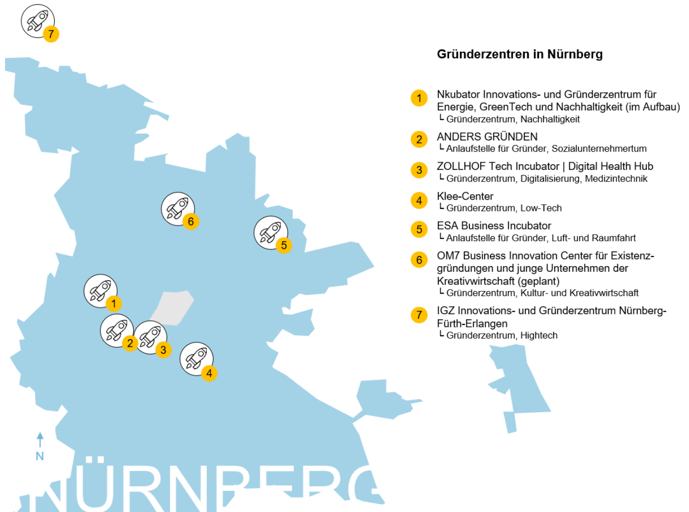
Abbildung 2: Inkubatoren, Innovations- und Gründerzentren in Nürnberg