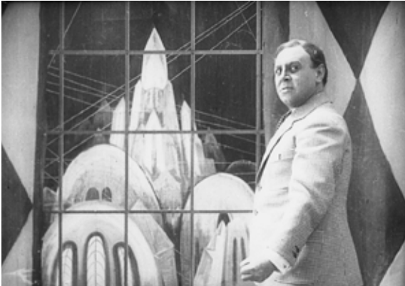
ALGOL. TRAGÖDIE DER MACHT