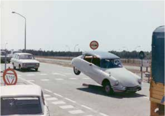
TRAFIC – TATI IM STOSSVERKEHR