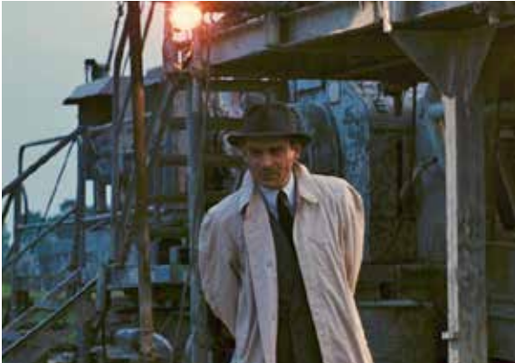
DER FALL MATTEI