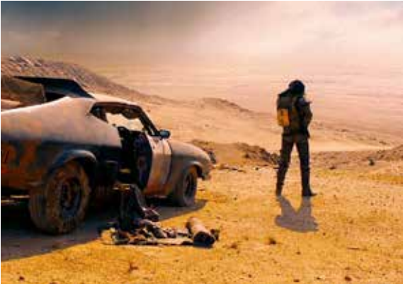
MAD MAX: FURY ROAD