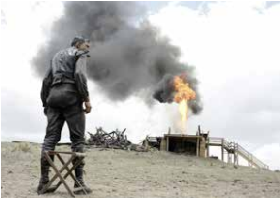
THERE WILL BE BLOOD