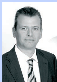
Schirmherr: Dr. Ulrich Maly, Oberbürgermeister der Stadt Nürnberg

Das Projekt FiBA 2 wird im Rahmen der ESF-Integrationsrichtlinie Bund im Handlungsschwerpunkt „Integration von Asylbewerber/innen und Flüchtlingen (IvAF)“ durch das Bundesministerium für Arbeit und Soziales und den Europäischen Sozialfonds gefördert.